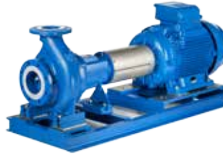
NSCF / NSCC

Grundplattenausführung Bauform B3 einschließlich Ausbaucupplung und wahlweise mit Instrumentenstand für Druckanzeigeeinstrumente