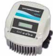
NSC.. mit Hydrovar

Je nach Anwendung mit Drucktransmitter oder Differenzdrucktransmitter, ausgestattet mit Anti-Kondensations-Heizvorrichtung