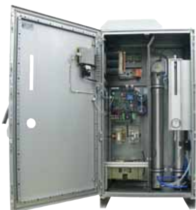
Innenansicht: GSO 50 Generator (links) und GSO 10 - 30