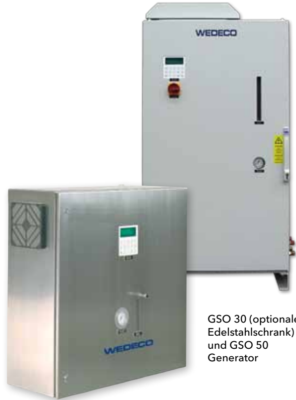
GSO 30 (optionaler Edelstahlschrank) und GSO 50 Generator